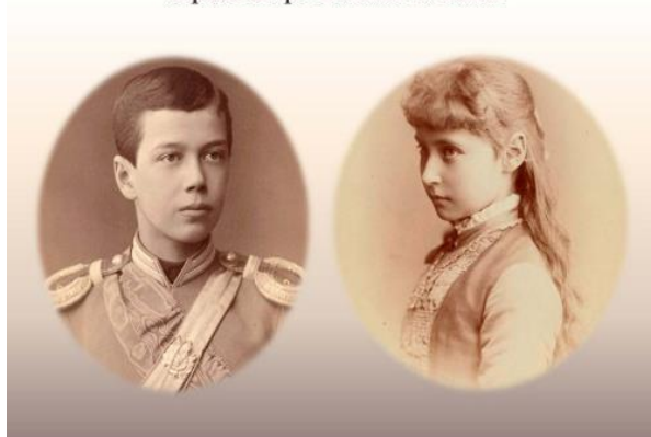
Первая встреча Аликс и Ники

Впервые Николай и Алиса встретились в 1884 году, когда Николаю было 16 лет, а Алисе 12 лет, на свадьбе дяди Николая - Сергея Александровича и сестры Алисы — Елизаветы Фёдоровны. Сначала между ними была близкая дружба, а затем светлая, беззаветная, самоотверженная любовь, соединившая их жизни до совместного принятия мученической кончины.